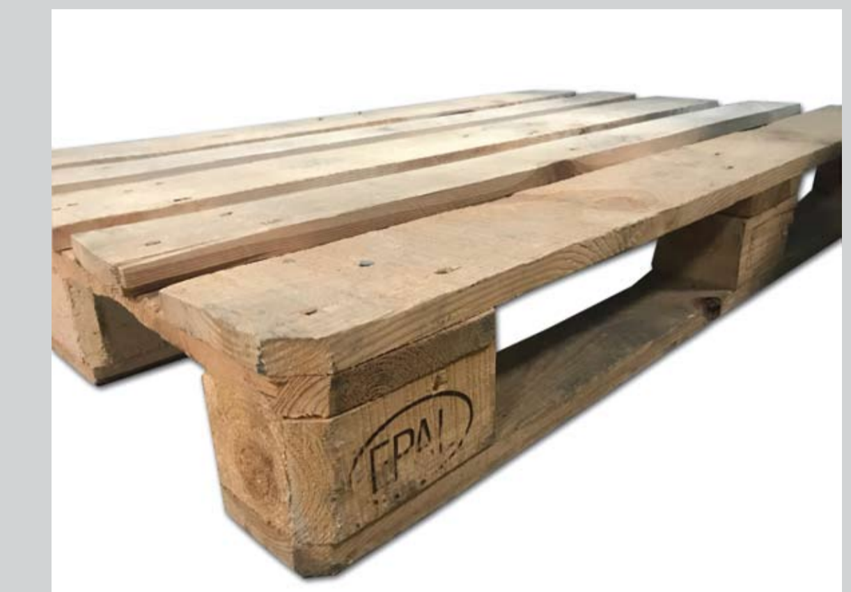
Przykładowe zdjęcie palety trzyletniej