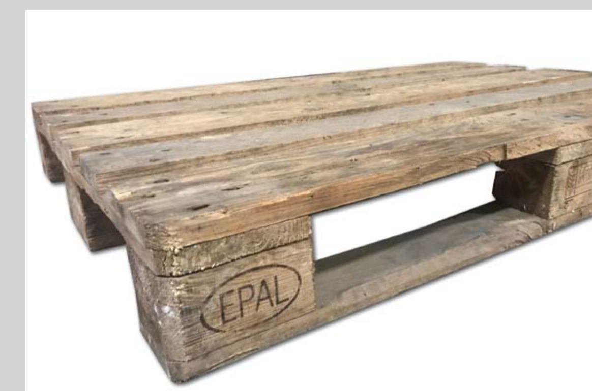
Przykładowe zdjęcie palety pięcioletniej