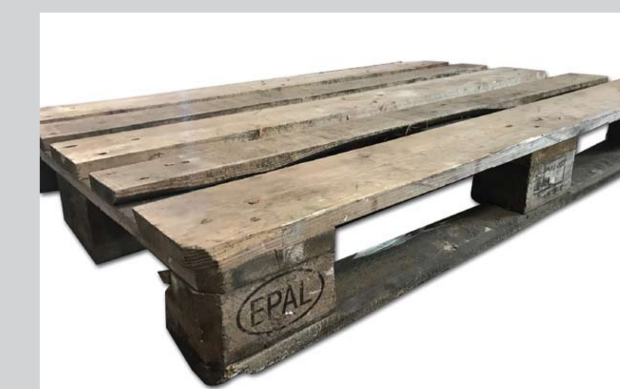
Przykładowe zdjęcie palety siedmioletniej

Palety EPAL są produktem markowym i podlegają ochronie przez Ustawę Prawo Własności Przemysłowej!