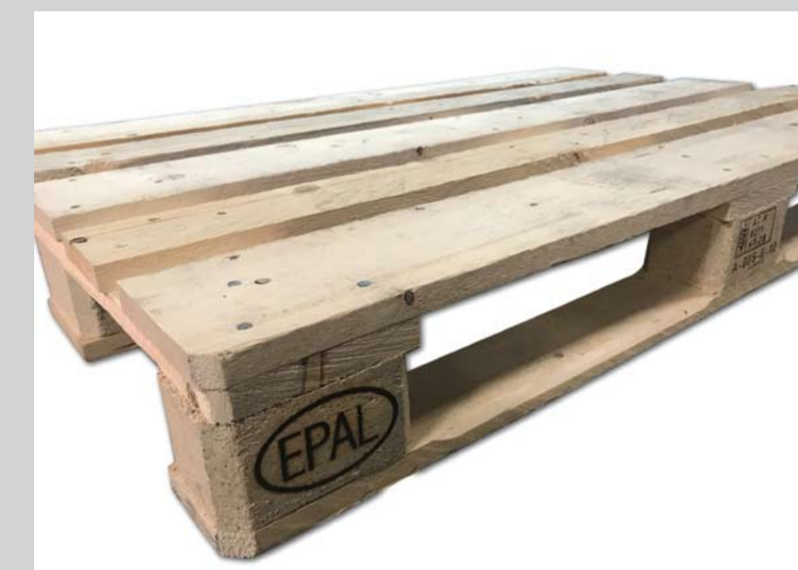
Przykładowe zdjęcie palety rocznej

Szary kolor palety, będący skutkiem naturalnego procesu starzenia się drewna, nie wpływa ujemnie na jej właściwości.